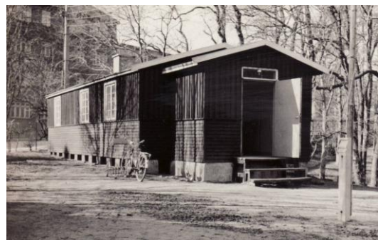
Vikingebo nr. 2, 1958